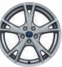
18" kola z lehkých slitin (na přání, za příplatek)