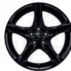
18" kola z lehkých slitin s 5 paprsky lakovány v barvě černá Shadow (volitelná výbava)