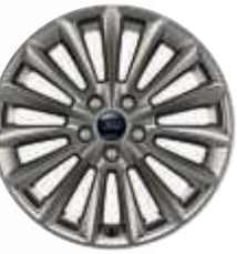
17" kola z lehkých slitin Rock Metallic (standardní výbava)

Zobrazenými vozy jsou Focus ST-Line s lakem karoserie stříbrná Moon dust* (vlevo) a bílá Frozen* (vpravo). Oba vozy jsou osazeny 18" koly z lehkých slitin v provedení Rock Metallic (za příplatek).