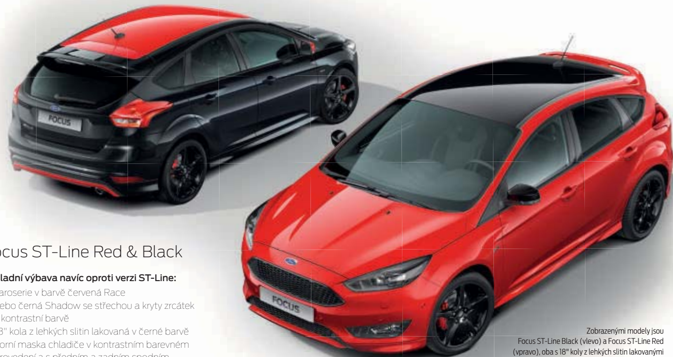
Zobrazení modely jsou Focus ST-Line Black (vlevo) a Focus ST-Line Red (vpravo), oba s 18" koly z lehkých slitin lakovány v barvě černá Shadow (standardní výbava).

Verze Red & Black nabízí stejné dynamické jízdní vlastnosti, jaké mají i ostatní modely Ford Focus ST-Line, avšak navíc zaujme svým nevšedním designem. Jedinečná kombinace lakování v barvě červená Race nebo černá Shadow se střechou a kryty zrcátek v kontrastní barvě společně s kompletní sadou exteriérových doplňků a koly z lehkých slitin v barvě černá Shadow perfektně podtrhují stylové a sportovní provedení vozu.