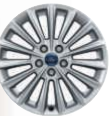
17" kola z lehkých slitin (na přání, bez příplatku)